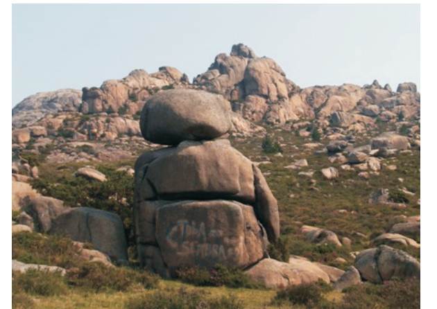
O Xigante do Pindo