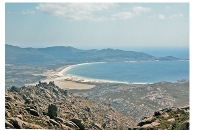
Praia de Carnota desde O Pedrullo