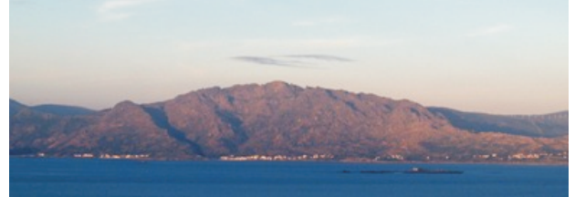
O Pindo desde Fisterra.

O tramo máis interesante é o que sobe desde o Pindo ata a Moa e tamén o de máis pendente. Nel podemos gozar de impresionantes paisaxes da serra, da enseada de Carnota, a ría de Corcubión e Fisterra. A cada volta do camiño iremos descubrindo suxerentes formacións rochosas. A ruta desde o Fieiro é máis doada, pero menos espectacular.