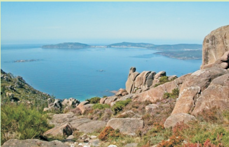
Fisterra desde a subida ao Pindo